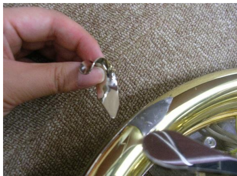
フレンチホルン 指掛けが引っかかって取れてしまった

これらの楽器は、保険適用されなければ何万円も修理費がかかります。楽器の盗難破損保険にご加入されていたため、免責¥5,000-のお客様負担で修理することができました。