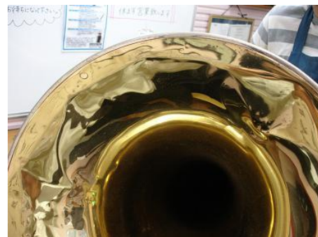
チューバ 楽器を落とされてしまい、 ベルがグチャグチャになってしまった