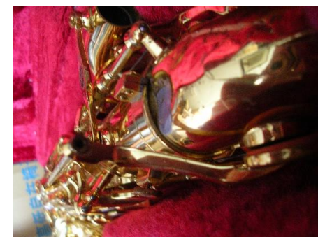
アルトサクソ 落ちてしまい、ベルト本体のつなぎ目から ハンダが外れてしまった。キーガードも 外れてしまった