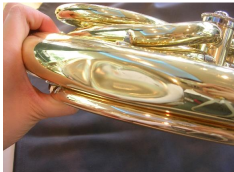
フレンチホルン 楽器を持ったまま階段から落ちてしまった

そこで、音楽舎の管楽器ユーザー様の負担を少なくしてさしあげたいという思いで出来たのが楽器の盗難破損保険です。