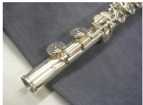
フルート 上から座られキイが曲がってしまった